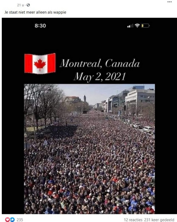
Foto toont geen massabetoging tegen coronamaatregelen in Canda

Deze foto werd gretig gedeeld op Facebook. Volgens de originele post toont de foto een protestmars tegen de coronamaatregelen in Montreal, Canada die plaatsvond op 2 mei. De foto dateert echter van 2018 en werd ook helemaal niet in Canada genomen. Het is een foto van een protestmars voor strengere wapenwetgeving in Washington DC onder de naam March for Our Lives. Die mars werd georganiseerd na de zoveelste dodelijke schietpartij op een school in de Verenigde Staten.